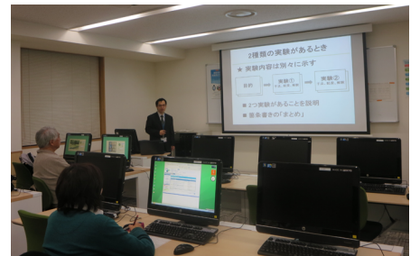
アカデミックスキルセミナーの様子(12/9)

アカサポではこれらのセミナーのアンケートを分析し、今後も学生のニーズに沿ったセミナーを企画・開催していく考えである。