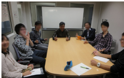
英語コミュニケーションの一幕(10/23)

英語コミュニケーションに活気がある。留学生チューターを少人数で囲み、英会話スキルを磨くもので、週に2回実施し、毎回定員に近い6名前後の参加者が集まる。"English Vocabulary"