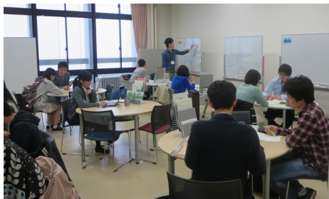
学習サポート室の様子(5/1)

学習サポートも連日賑わっている。特に物理や化学、実験レポートの書き方についての質問が目立ち、平常時で例年の試験