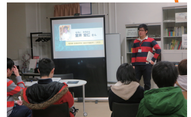
進路相談会での一幕(2/6)

アカサポでは今後も様々な進路相談に関するイベントを行う予定です。皆様方のご協力をよろしくお願いいたします。