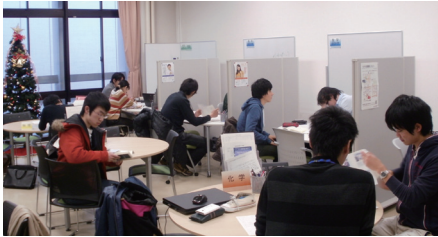
学習サポート室の様子(12/16)

今年度の学習サポート利用者数は延べ2795人(2月末時点)で、昨年度の2577人を200人以上も上回る盛況となりました。科目毎の内訳は、昨年度とほぼ変わらず、数学38%、物理21%、化学11%、実験レポート11%、その他19%となりました。試験が近づいてからようやく