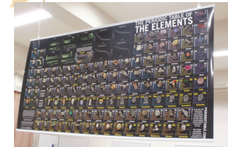
巨大周期表が学習サポート室に登場

創立3周年を迎えたアカサポの学習サポート室(E211)がバージョンアップしました。天井からは「世界一美しい周期表ポスター」(仮説社)と「グローバル世界全図」(グローバルプランニング)が吊り下げられ、新設の本棚には「Newton」や「日経サイエンス」等の雑誌類のみならず数々の図鑑や事典が並べ