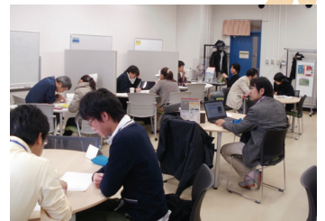
2学期中間試験期の様子

しょう先生を招いて、海外での生活や勉強について英語でディスカッションします。「物理学初級ゼミ」は、今学期も全学教育科目の「物理学II」と連携し、演習問題解説を中心として開講中です。11月に熱力学を終え、12月からは電磁気学がスタートする予定です。